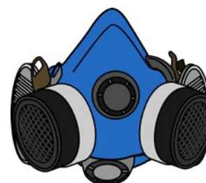
Rys. 9. Półmaska z pochłaniaczami