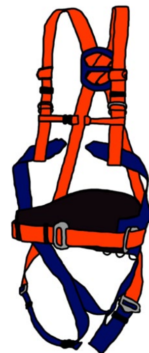
Rys. 10. Szelki bezpieczeństwa