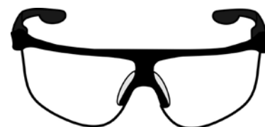
Rys. 7. Okulary ochronne