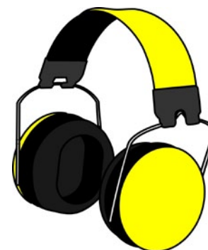
Rys. 8. Ochronniki słuchu